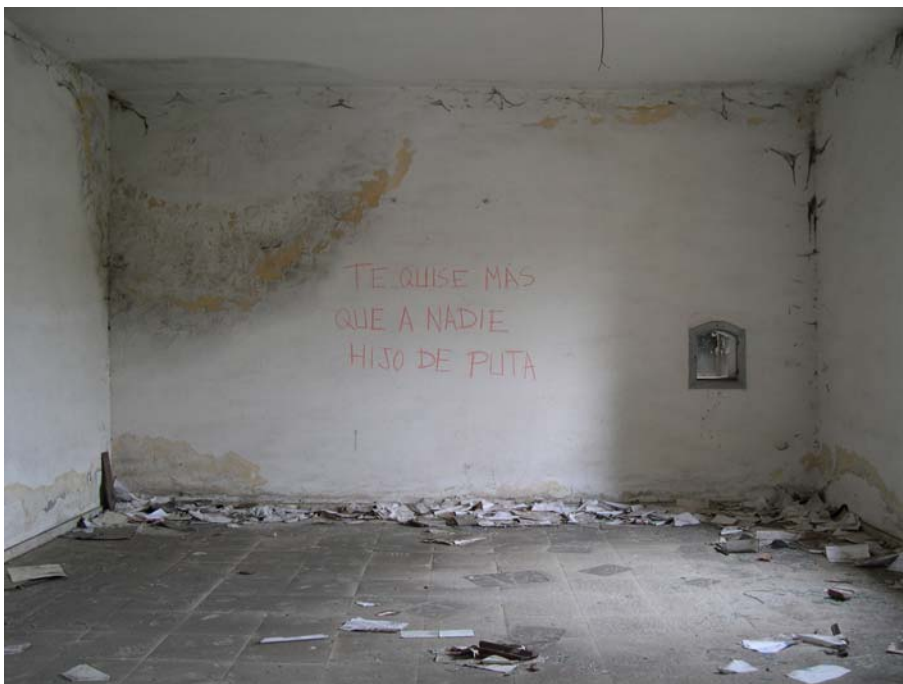
1 de nov. 2000 a 24 de nov.2003, 2004 Fotografía digital 75 x 100 cm. Edición de 5 + 2 P/A