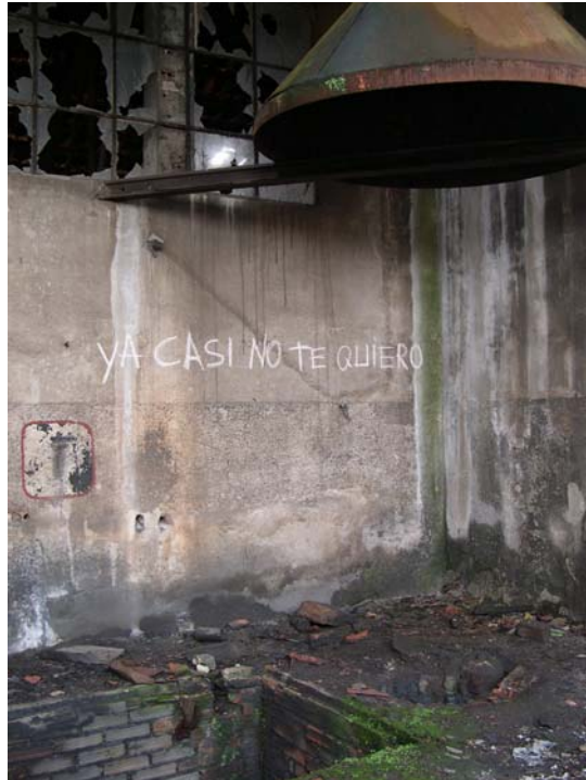
25 de noviembre, 2004 Fotografía digital 100 x 75 cm. Edición de 5 + 2 P/A