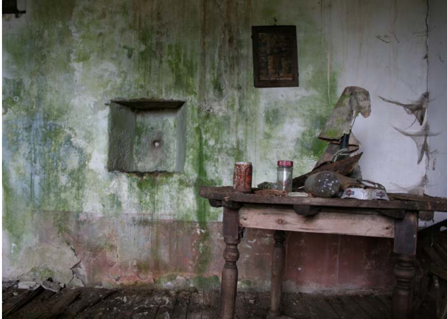
1977, recuerdo. 2006 Fotografía digital 75 x 105,08 cm. Edición de 5 + 2 P/A