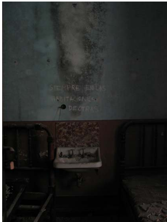
primavera...invierno, 2005 Fotografía digital 100 x 70 cm. Edición de 5 + 2 P/A