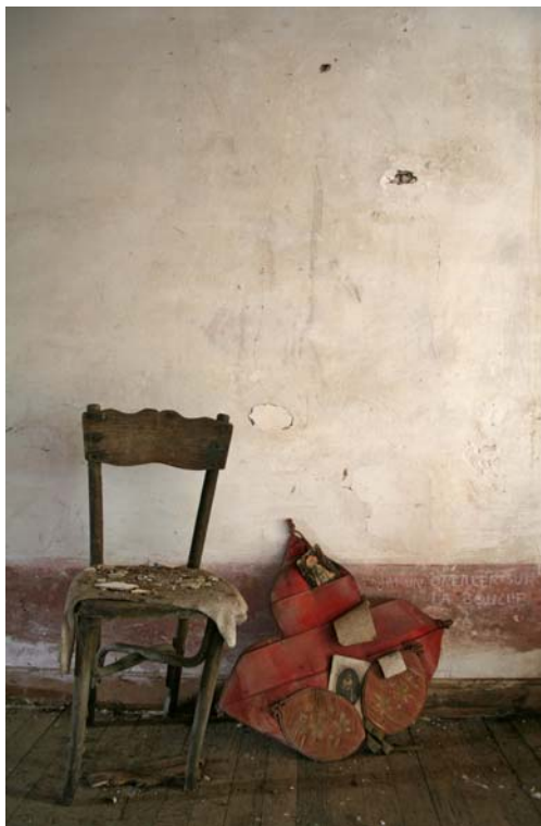
R. [detalle], 2008 Instalación compuesta por: Fotografía digital ed. 7 + 2 P/A [114 x 76 cm.] y objetos encontrados. Dimensiones variables

En sus obras siempre presenciamos un valor de lo escrito, de la caligrafía, del testimonio. Así, estos murales, cruce de dibujos y objetos, documentos, ofrecen esa discreción del elemento cotidiano, habitual, de lo confesional, del testimonio. Murales formados de imágenes, emblemas que actúan de pequeños relatos narrados, en la esencia de lo escenográfico, de una habitación privada conformada de recuerdos, de vivencias, de dudas, incorrecciones desde una experiencia literaria. Traslado el mismo aparente orden/desorden que se observa en sus fotografías, de muebles cubiertos de polvo, descuidados, a murales que traducen una construcción cotidiana, en tránsito, en proceso. Siempre esa dualidad entre lo público y colectivo, ficción y realidad, una búsqueda dimensión que bebe de una primera persona, de quien escribe, narra, y se proyecta a una colectividad. Obras que protagonizan una expansión en las paredes, como un mapa de experiencias, un territorio intermedio, sucesión de estratos que reconocen los signos, los relatos, lo posible, lo eventual, siempre en las claves del tiempo, de la memoria.