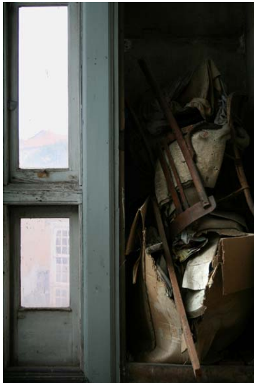
aquí es donde los escondo, 2006 Fotografía digital 105 x 70 cm. Edición de 5 + 2 P/A